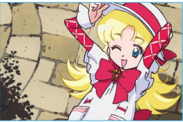
旅と舞台の躍動が待っている!

おジャ魔女どれみドッカ〜ン! (40話) MAGICAL DO RE MI 4 (Episode 40) 2002