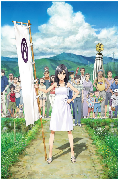
世を織りなす人たちの笑顔と戦い

時をかける少女 The Girl Who Leapt Through Time 2006