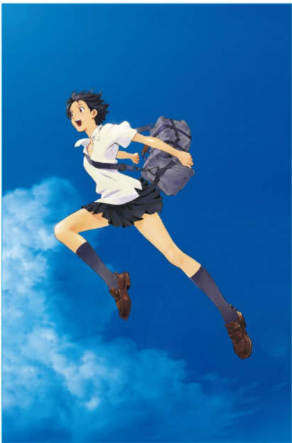
新たなステップ、青春のときめき

村上隆作品 The Creatures From Planet 66 〜 Roppongi Hills Story 〜 2003