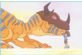
子どもにしか見えないものがある

The World's First Full-Scale Mamoru Hosoda Retrospective