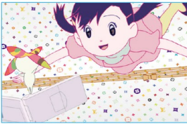
村上隆×ルイ・ヴィトン×細田守