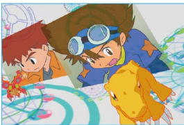
ネット時代に起きる新たな奇跡

劇場版デジモンアドベンチャー ぼくらのウォーゲーム! Digimon Adventure OUR WAR GAME!! 2000