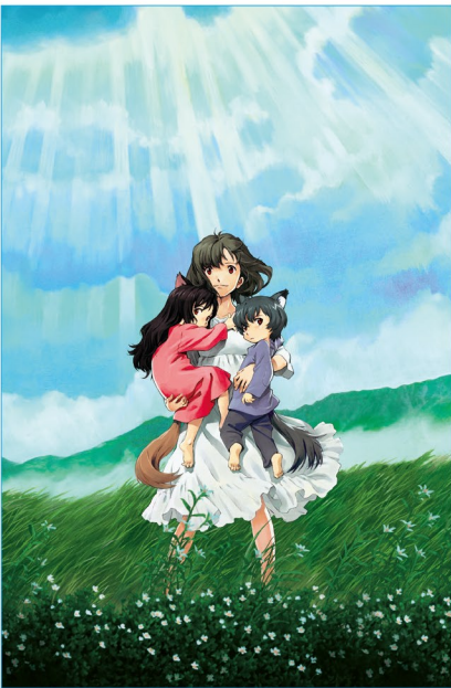
究極のテーマ《母と子》への挑戦