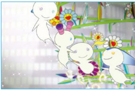
六本木ヒルズ開業の祝祭感

村上隆作品 The Creatures From Planet 66 〜 Roppongi Hills Story 〜 2003