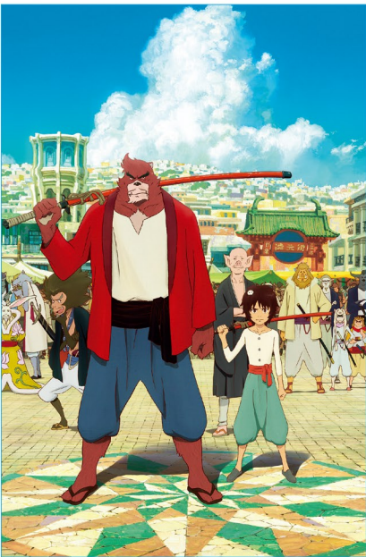
重なる世界が少年を成長させる